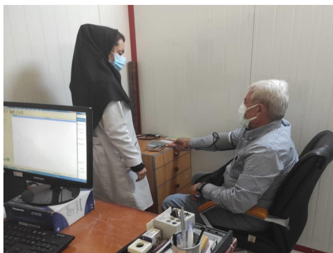
تصویر د: مرحله ورود دیتا- اندازه گیری فشارخون