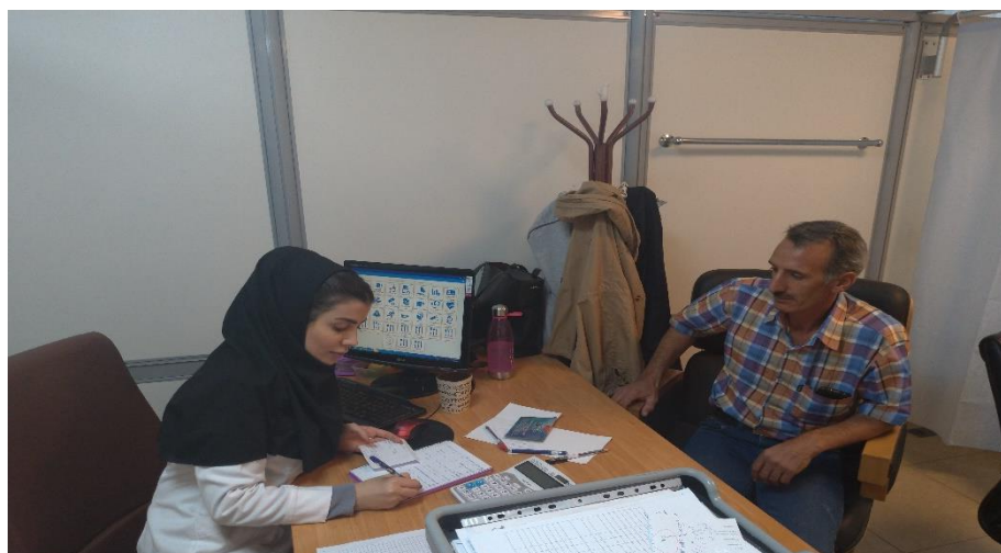
تصویر الف: مرحله ورود دیتا-کارشناس در حال تکمیل پرسشنامه

بر اساس اهداف عنوان شده این مطالعه از تمامی ۷۲۲۵ نفر افراد وارد شده به مطالعه در مرحله ورود دیتا اطلاعات دموگرافیک، اطلاعات تغذیه ای، شاخص های آزمایشگاهی از میزان قندخون ناشتا، پروفایل لیپید، فشارخون، قد و وزن و اطلاعات تن سنجی و تشکیل بیوبانک به عنوان داده های اولیه جمع آوری گردید. برای کلیه افراد ریسک ده ساله ابتلا به سکته قلبی- مغزی محاسبه گردید. (Q risk)