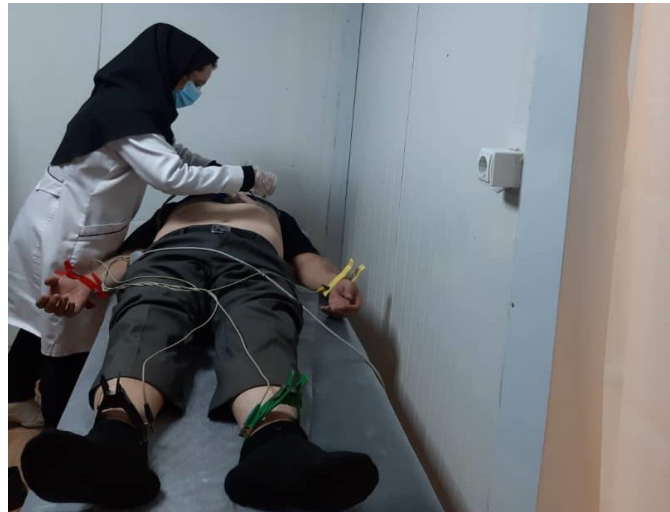
تصویر ج: مرحله ورود دیتا- گرفتن نوار قلب